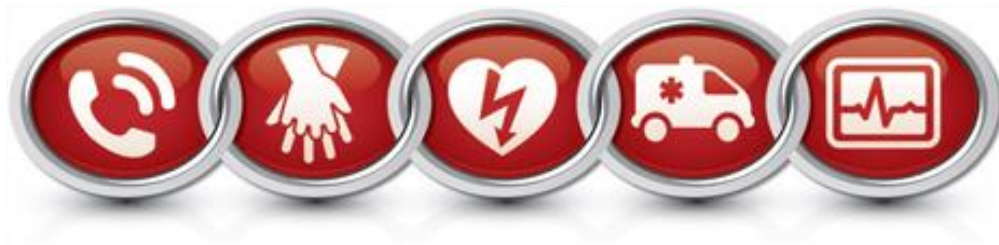
Figure 1. Concept de chaîne de survie selon American Heart Association (AHA) et International Liaison Committee on Resuscitation (ILCOR)

En Suisse, le taux de survie à un arrêt cardiaque est estimé à 5-10%, mais ce chiffre peut varier de manière importante en fonction de facteurs prédictifs de bon pronostic tel que la survenue de l'AC dans un lieu public, la présence de témoin, la mise en œuvre précoce d'un massage cardiaque, la défibrillation précoce, l'arrivée rapide des secours et une fibrillation ventriculaire comme rythme initial.